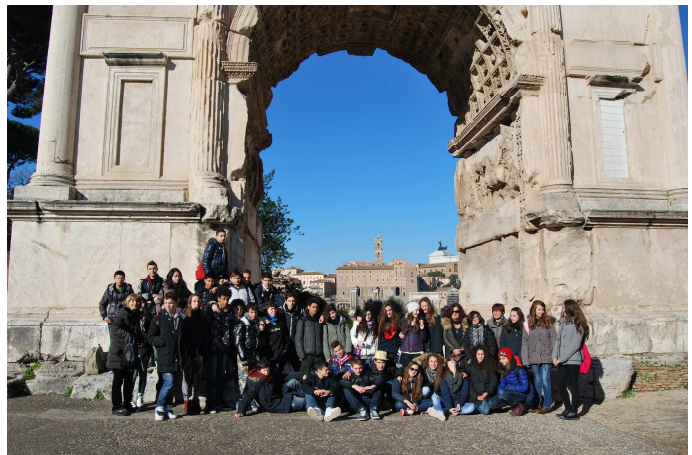
(Continua a pagina 4)

Piccola pausa per digerire, fermata ad un bar bruttissimo dove i prof hanno bevuto un caffè ( ma ci vuole un'ora per bere un caffè ???). Finalmente gelato alla famosa gelateria romana "Giolitti", relax time e partenza per il Parlamento.